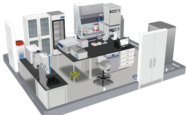
ラボデザイン例2：細胞培養室