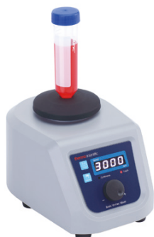
ベーシックボルテックス ミキサー