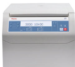
ST 8 (冷却なし)