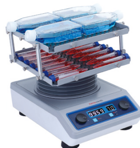
デジタルプラットフォーム ロッカー