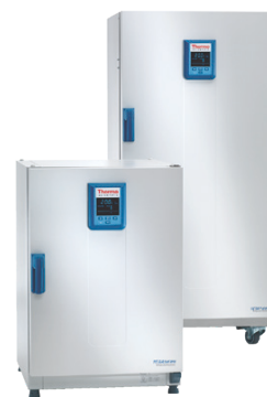
Heratherm IMP180 & IMP400