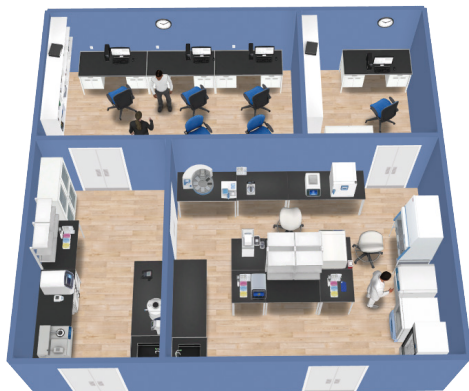
ラボデザイン例1：分子生物学実験室