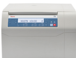
ST 8R (冷却付き)