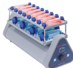
デジタルチューブロッカー