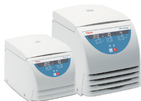
Micro 21 (冷却なし) Micro 21R (冷却付き)