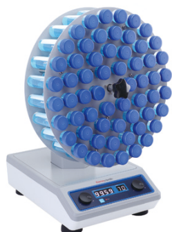
デジタルCell-Glo ティッシュカルチャーローテーター