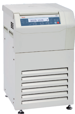
ST 8FR (冷却付き)