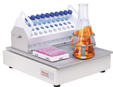
MaxQ 2000 CO2 Plus