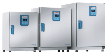
Heratherm IGS60 / IGS100 / IGS180